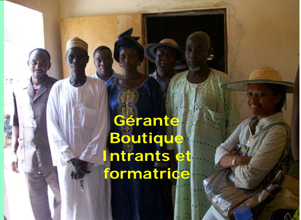
Gérante Boutique Intrants et formatrice

GROUPE 2: Burkina-Cameroun- côte d'Ivoire- Madagascar-Mali- Niger- Sénégal -Togo- Tunisie