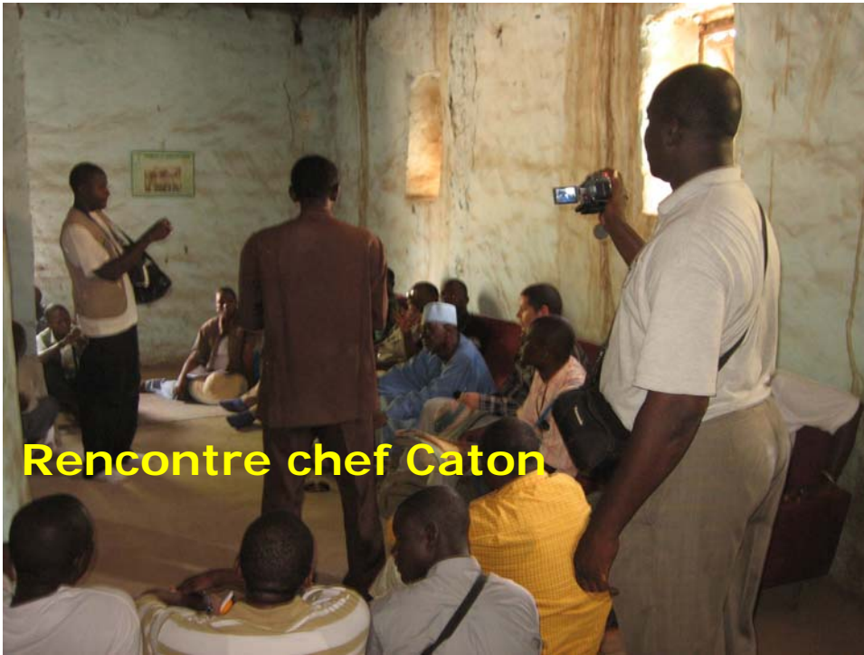
Rencontre chef Caton