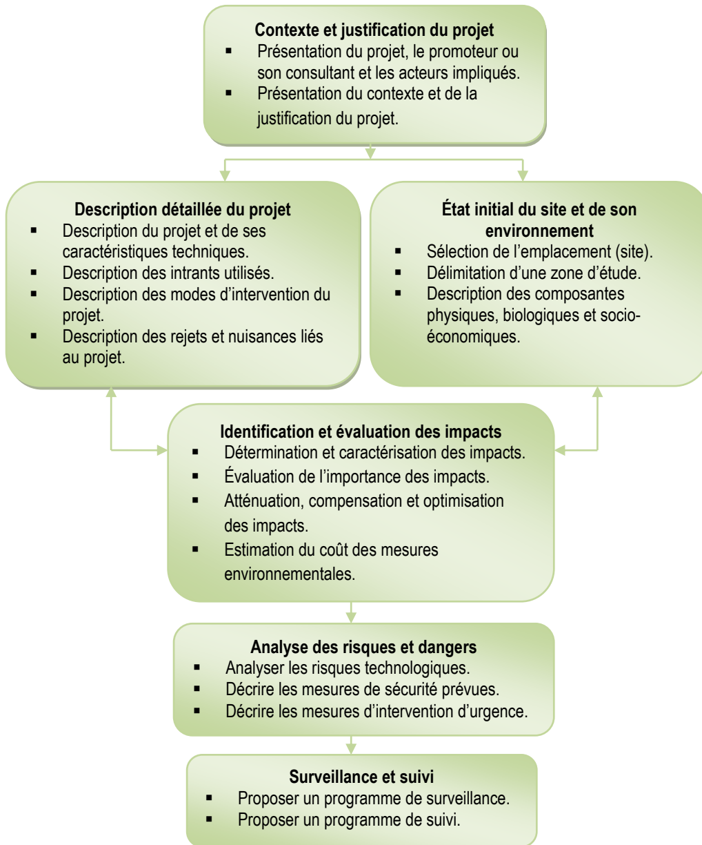
Figure 2 : Démarche d'élaboration de l'étude des impacts sur l'environnement au Mali